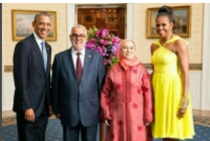
Photo-Souvenir de Abdelilah Benkirane et son épouse chez les Obama !