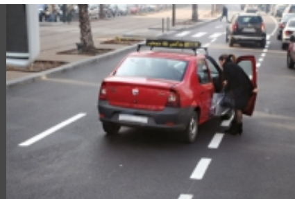
Le diktat des chauffeurs de taxis sur les routes...