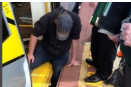
Des voyageurs soulèvent le métro pour sauver un homme coincé entre la rame et le quai !