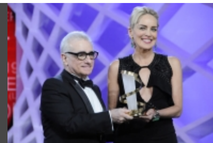
Festival international du film de Marrakech 2013 : Martin Scorsese et Sharon Stone