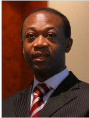
Achille BASSILEKIN III, Secrétariat Général du groupe des Etats ACP