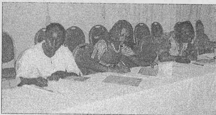
La presse a pris connaissance des objectifs de la 2e phase du PIP.